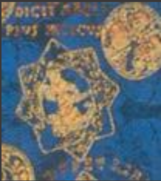
Ophiuchus (and Scorpio)